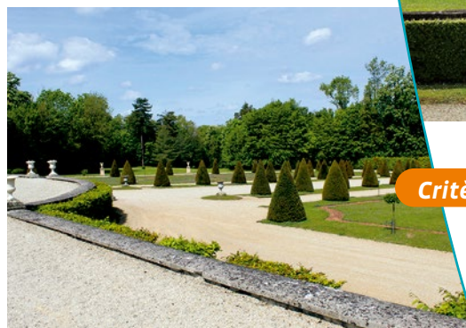
Une partie du parc

a été classé à la demande de sa propriétaire de l'époque, Mme la Marquise de Maillé en 1969. Ce classement apparaissait comme un complément indispensable à la protection en tant que monument historique du château et du parc de la Motte-Tilly.