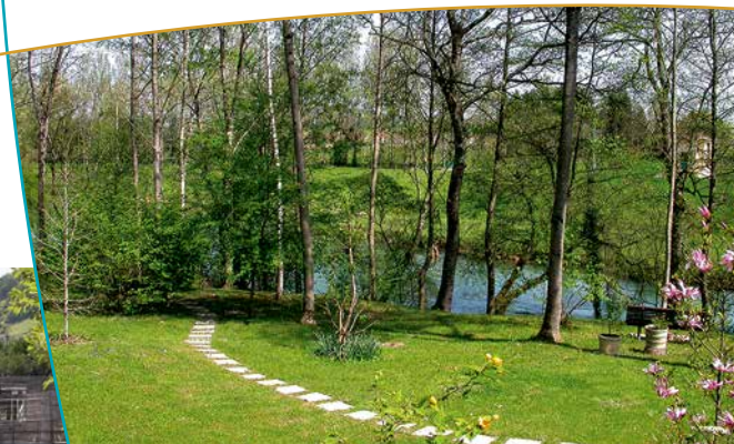
Aménagements au sein du site