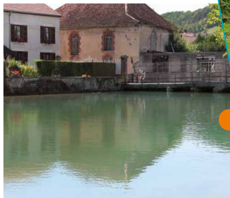
Bâti le long de la rive

édifiées en plusieurs points de ses rives. En complément des règles et servitudes de construction édictées dans le plan d'urbanisme de Bar-sur-Aube, une procédure de protection au titre des sites a donc été décidée.