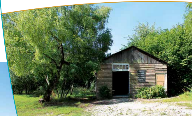
Cabane à proximité de la stèle