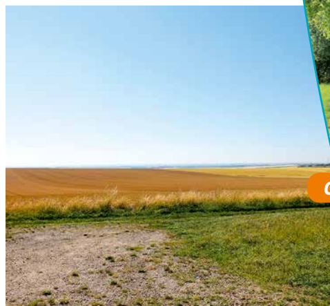
Vue des plaines cultivées entourant le site

munitions ne pouvaient plus alimenter les troupes et, de ce fait, ces actions ont facilité le débarquement du 5 juin 1944.