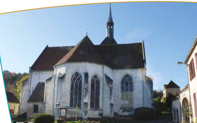
L'Église de Bérulle