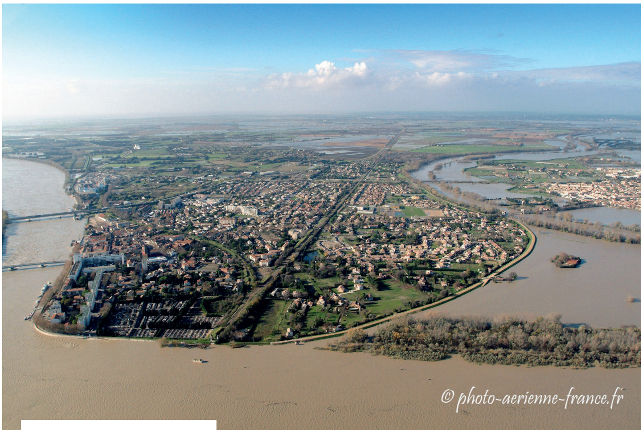
Le quartier Trinquetaille d'Arles