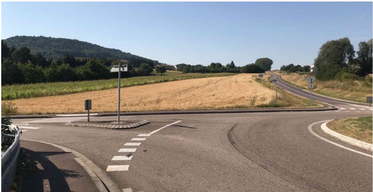
VUE DU ROND-POINT (PC 8)

Nota : Veuillez consulter la pèce annexe N°4 (vue en plan) pour le repérage des prises de vue.