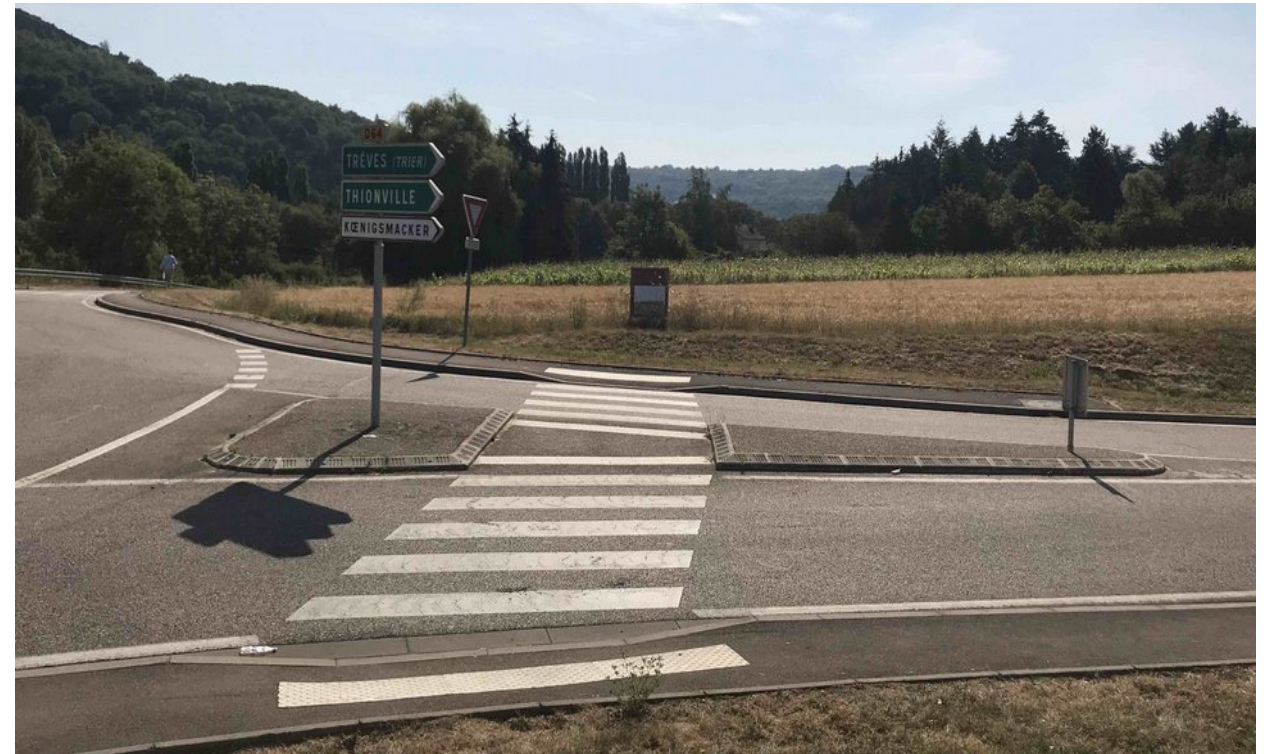
VUE DU ROND-POINT (PC 7)