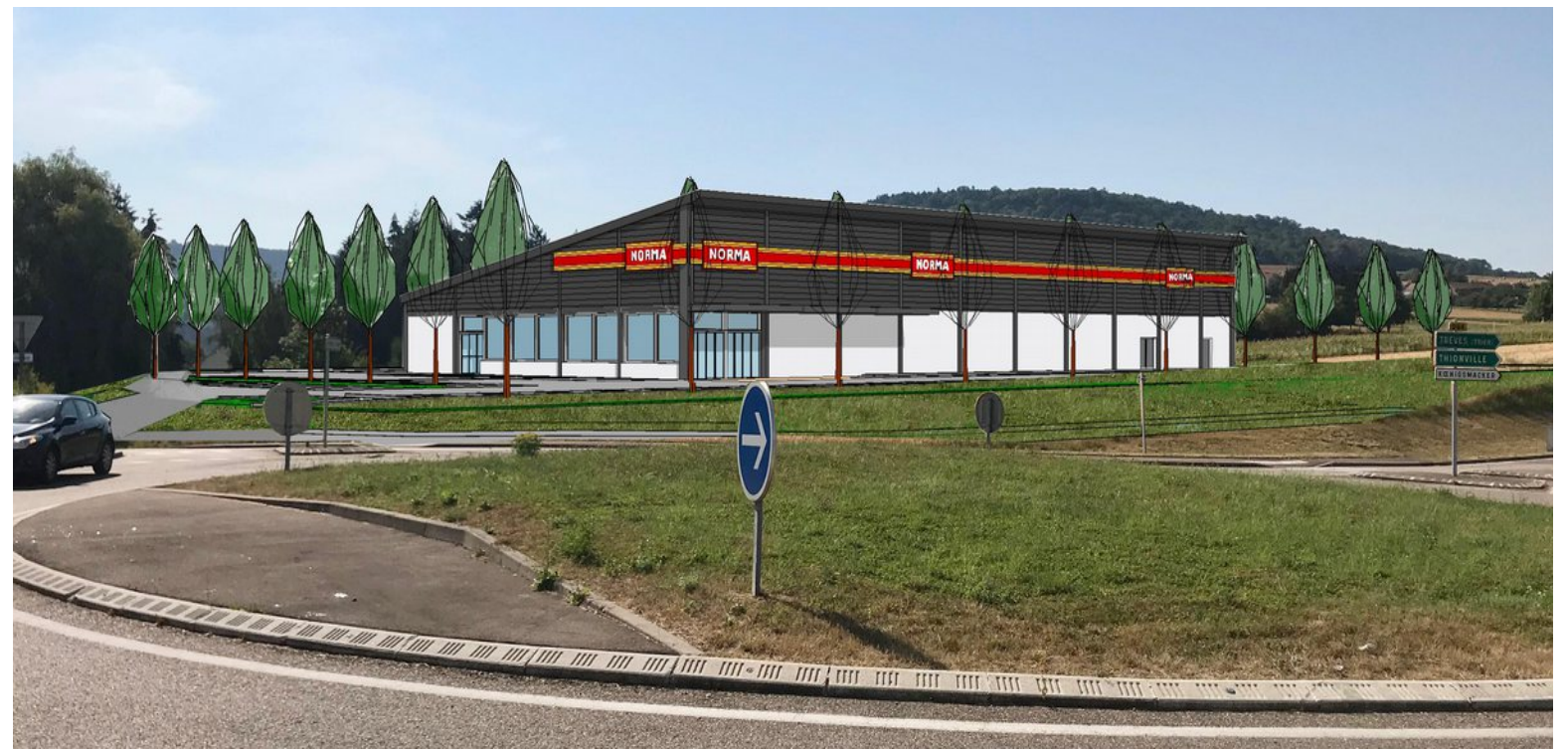
VUE DU ROND-POINT -ZAC DE RETTEL (INSERTION PC6)