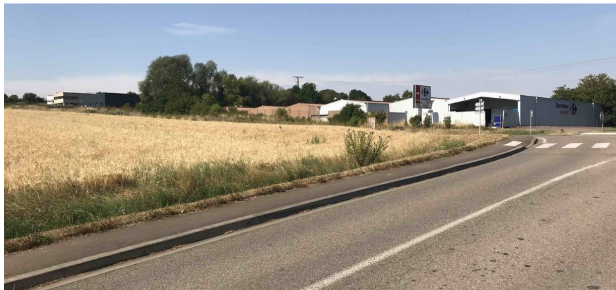
VUE 1 – DE LA RUE DE SIERCK (FUTUR ACCES)