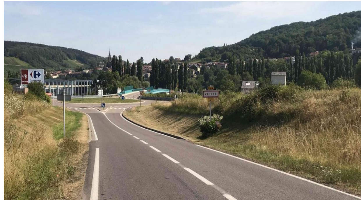
VUE 2 – RD 64- DIRECTION RETTEL , PONT DIR. CONTZ LES BAINS