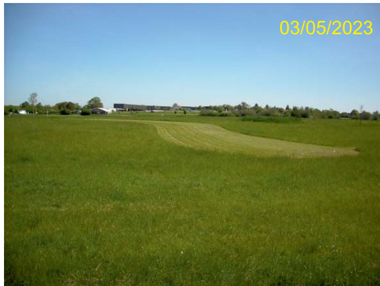
1. Vue générale du site d'implantation