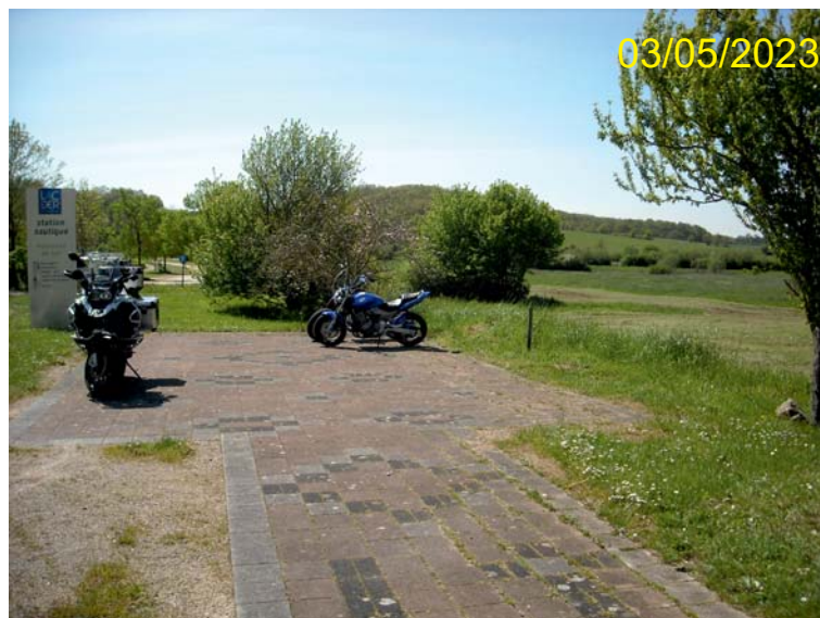
2. Vue rapprochée du site d'implantation