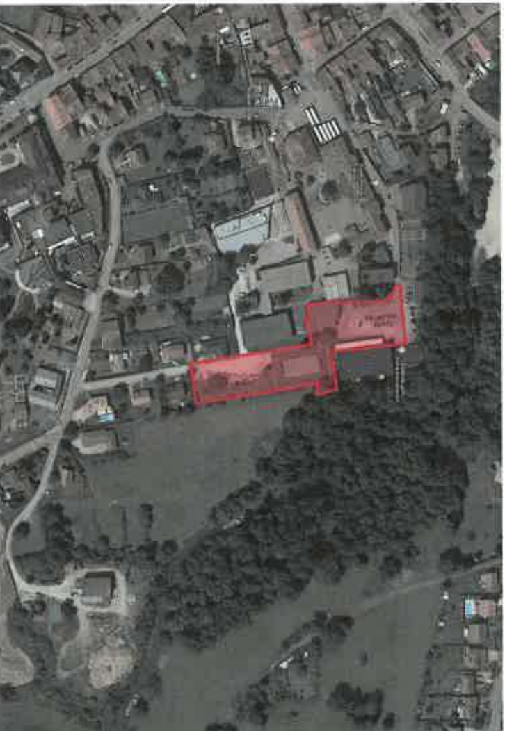
Vue aérienne du terrain dans la commune de Bayon