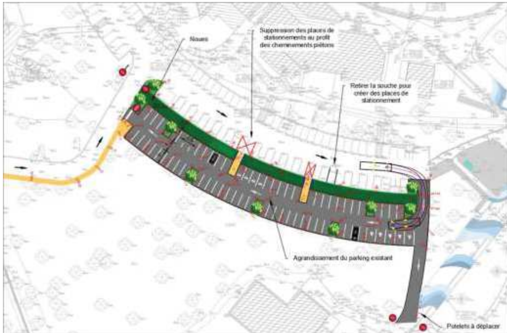
Fig. 3. Plan du parking Centre 3

Le parking est conçu de la même manière que le parking Sud 2 avec des objectifs d'infiltration des eaux pluviales. Des candélabres seront installés et des caméras mises en place.