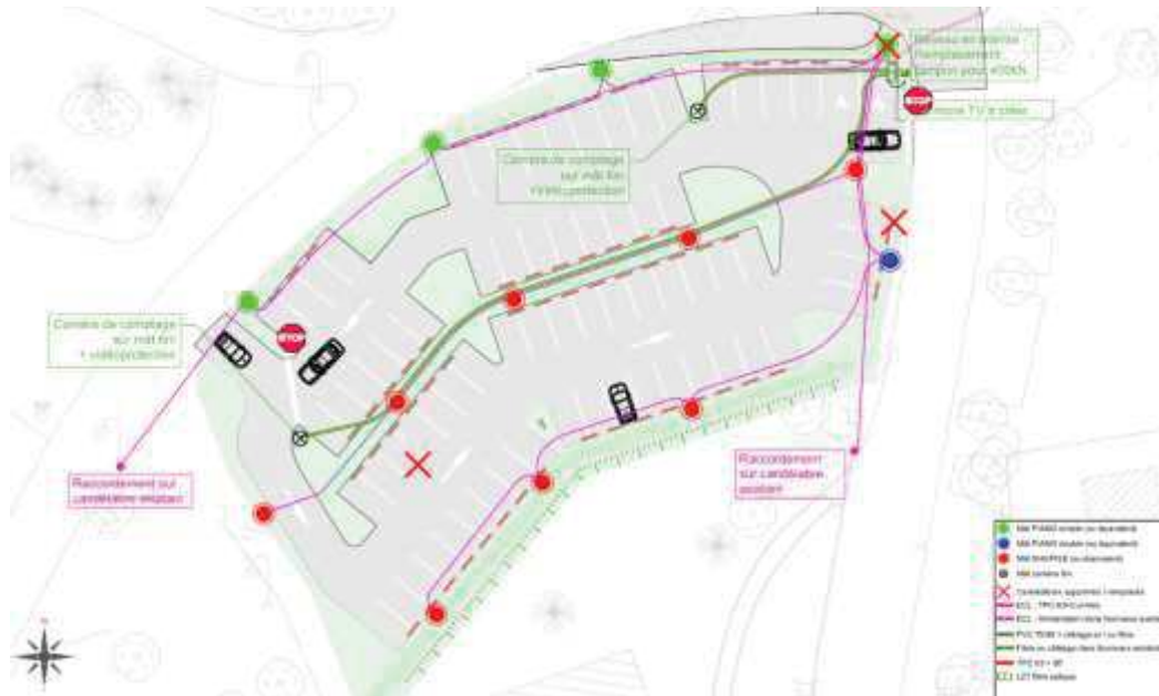
Fig. 2. Plan des réseaux secs – Parking Sud 2