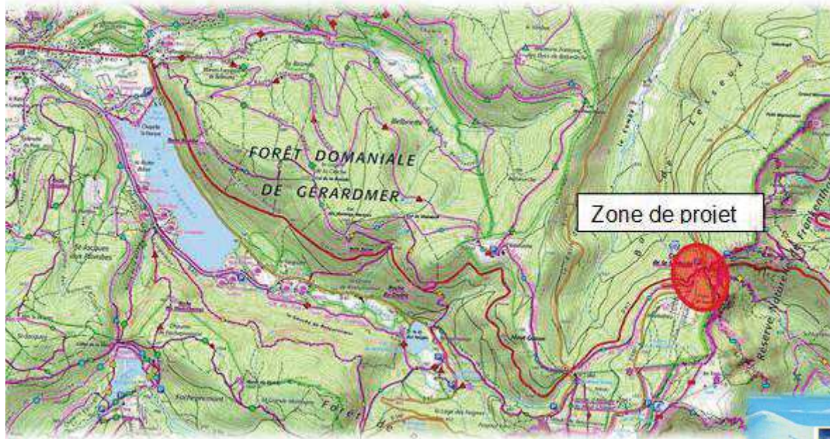
Extrait plan de situation