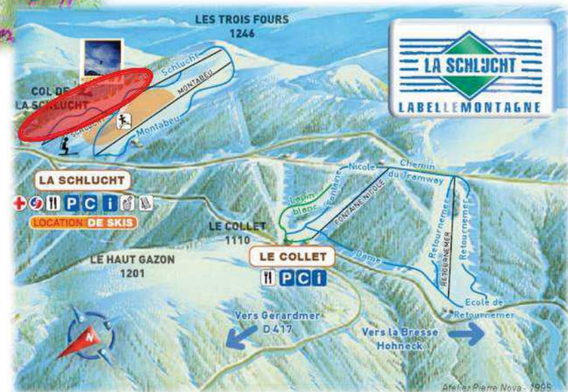
Situation sur plan des pistes