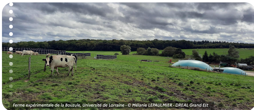
Ferme expérimentale de la Bouzule, Université de Lorraine - © Mélanie LEPAULMIER - DREAL Grand Est

En sus de tous ces textes législatifs et réglementaires spécifiques aux projets photovoltaïques sur espaces naturels, agricoles et forestiers, les pétitionnaires doivent respecter les dispositions de droit commun relatives au code de l'environnement (évaluation environnementale, examen au cas par cas, dérogations espèces protégés, dossier loi sur l'eau ... ) et au code de l'énergie (volet raccordement).