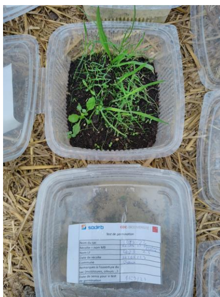
Exemple d'un test de germination des semences récoltées

Les résultats sont très encourageants : les tests de germination ont montré que les graines ont un bon pouvoir germinatif ; les graines ont également levé sur les parcelles semées à l'automne 2023.