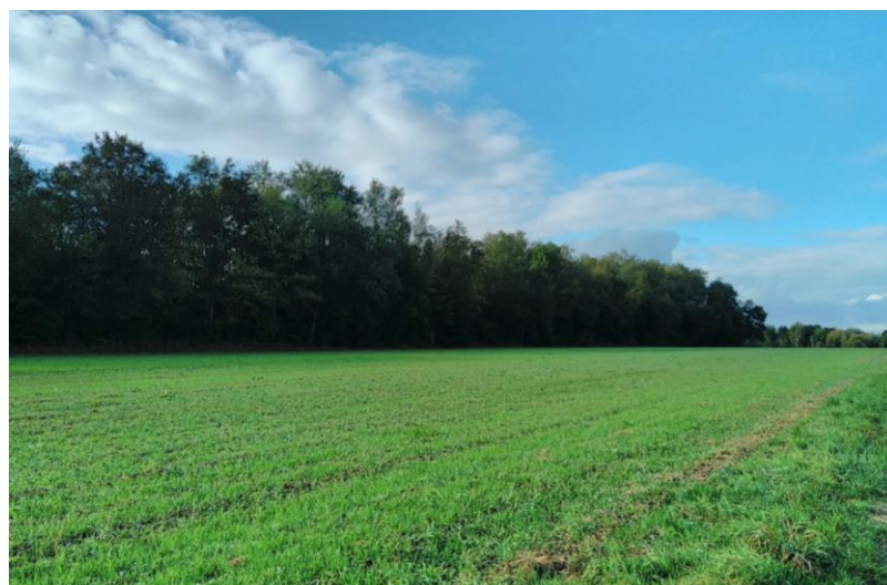
Levée constatée sur une des parcelles sur lesquelles les semences récoltées ont été semées – commune de Foussemagne dans le département du Territoire de Belfort