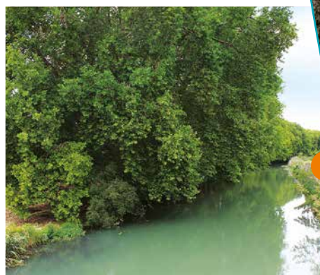
Allée des platanes en direction de Saint-Martin

la Marne ou du canal d'amenée, soit vers 1850 – 1870, sans autre précision. Ces platanes sont caractérisés par une très grande hauteur et un important développement du houppier, avec inclinaison des fûts vers le Canal Saint-Martin.