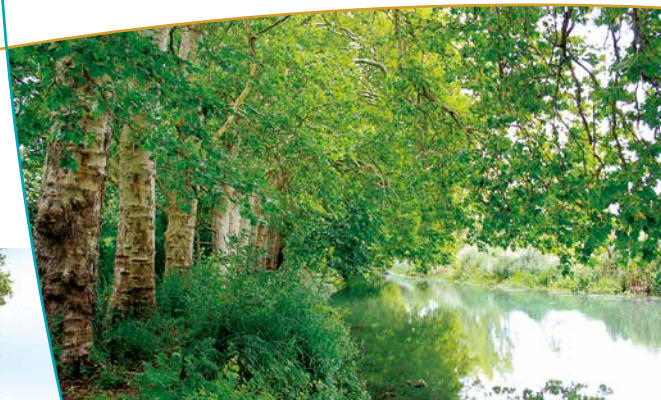
Chemin longeant les platanes