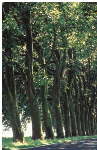
Les piliers de platanes

La majorité des arbres actuels ont été plantés en 1867. En 1989, la mairie a souhaité procéder à l'aménagement des abords de l'allée de platanes classés afin d'agrémenter le site par une allée piétonnière. Celle-ci permet ainsi une meilleure découverte du village, de son église et de la montagne de Reims. L'alignement le long de la chaussée comporte 145 platanes. A l'exception de deux érables sycomores et d'un jeune platane récemment plantés, l'alignement est homogène et offre une entrée très pittoresque et majestueuse dans le village de Damery.