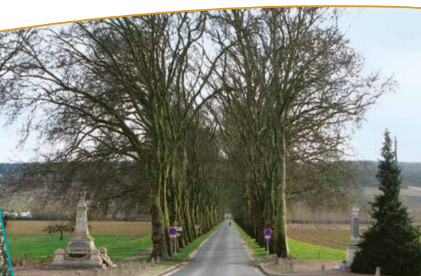
Allée des platanes et monument aux morts