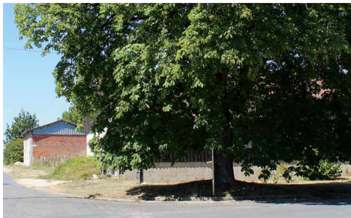
L'arbre de la liberté

où de nombreux arbres furent plantés à travers la France pour saluer la Révolution. Un panneau de signalisation est installé au bas de cet arbre.