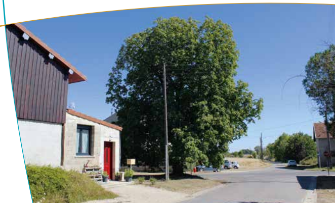
Vue d'ensemble avec le marronnier