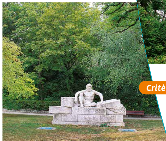
Sculpture représentant le 1 er architecte

d'imposants réseaux de caves, à même la craie. Cette butte représente les derniers vestiges de l'enceinte fortifiée de Reims, démolie au cours du XIX e siècle.