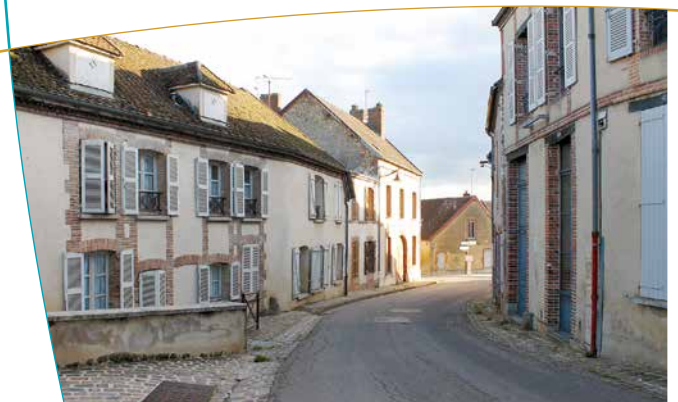
Maisons typiques du centre ancien

Après la disparition du Château au XVIII ème siècle, la ville retrouve une prospérité et nombre de communautés religieuses participent activement à la reconstruction. L'unité de la construction du centre-ville reflète une certaine originalité et le tracé des voies publiques, reliques médiévales, confère un charme absolu aux rues et ruelles. Trois types de maisons coexistent dans le tissu architectural de la ville : les maisons à pans de bois, les maisons dites « sézannaises » datant du XVII ème et XVIII ème siècle en pierre et en brique et quelques maisons de la fin du XIX ème et du début XX ème , très belles demeures en parfaite harmonie avec l'architecture des siècles précédents.