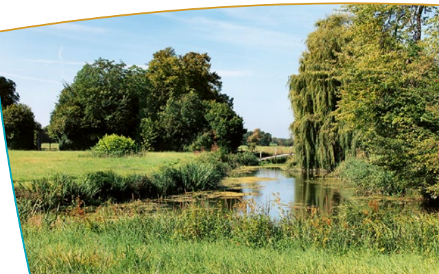
Passerelle et cours d'eau au sein du parc

du XVII ème siècle (boiseries, encadrements de portes, escaliers de service,...) mais le plus remarquable est l'ensemble de la chambre dite du Chevalier, composée de boiseries datant du XVIII ème siècle. L'ensemble des bâtiments est couvert d'un toit à la Mansarde percé sur chaque face de 3 lucarnes : 2 en bois et celle du centre en pierre avec un fronton triangulaire. Au sommet, un observatoire octogonal permet de surveiller les environs. Le parc, bien entretenu, a conservé une partie des anciens fossés, encore remplis d'eau. Il est fermé d'un mur en craie. L'ancienne porte principale, constituée d'une grille en bois, se trouve côté ouest, à l'opposé du village.