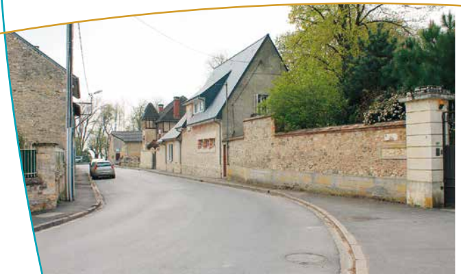
Rue au coeur du village