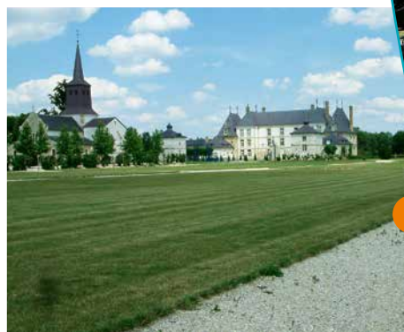
Le parc réaménagé

qui méritait d'être protégé. En 1848, pour fermer le jardin coupé par la ligne de chemin de fer Paris-Strasbourg, l'ancien propriétaire avait eu l'idée de fermer le jardin à l'est par une pièce d'eau en fer à cheval, alimentée par le canal.