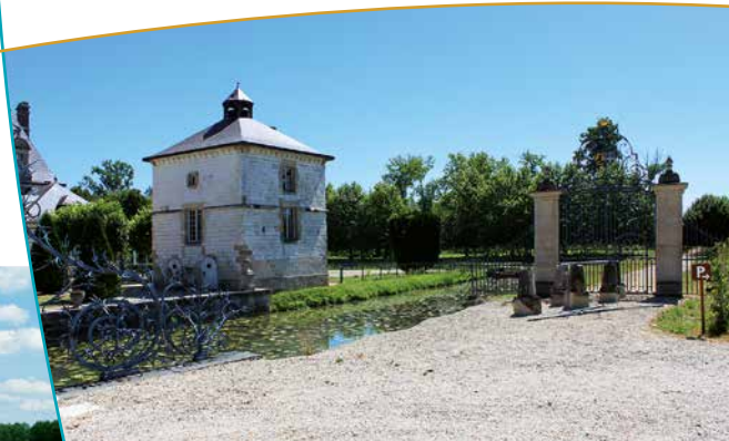
Pavillon et grille