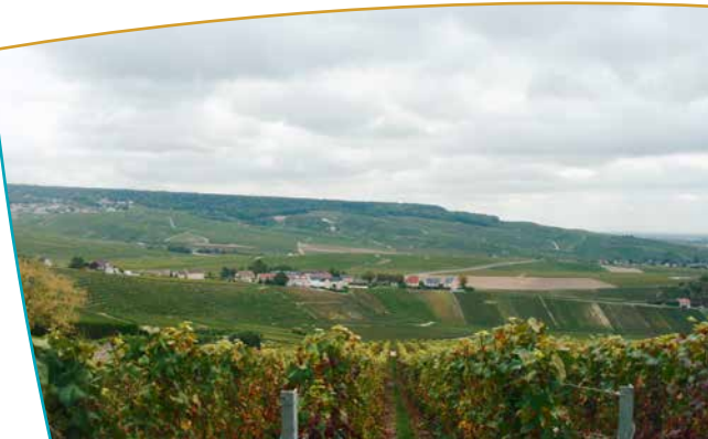
Vue depuis les Crémonts

extrême, où chaque élément trouve sa place au sein d'un paysage paisible et harmonieux, traduisant une fusion équilibrée de l'homme et de son environnement. La valeur historique du site est remarquable. Les coteaux, par le vignoble et par leur patrimoine architectural, illustrent l'ensemble de la filière professionnelle viticole : vendangeoirs, maisons vigneronnes, coopératives. Ils constituent le berceau historique et symbolique du Champagne : la présence très ancienne du vignoble, de l'abbaye d'Hautvillers où le moine Dom Pérignon a joué un rôle essentiel dans la genèse du Champagne, fondent le caractère particulier de ce territoire.