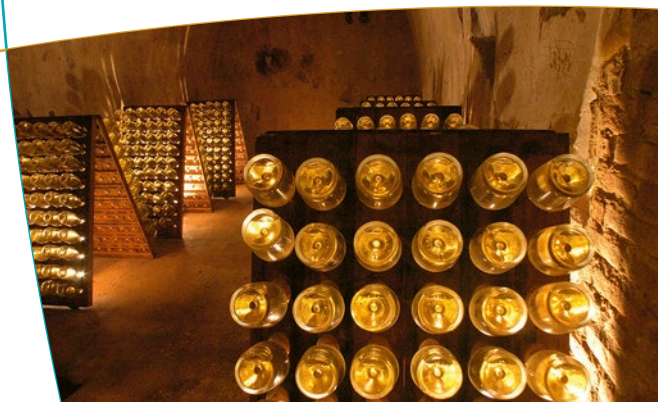
Vue sur un couloir d'accès à la crayère

et est la première à avoir utilisé les crayères pour y entreposer ses précieux flacons. En 1760, un siècle avant les autres, son fils, Claude Ruinart, décide d'installer ses bâtiments commerciaux sur la butte du Moulin-de-la-Housse, en plein quartier des crayères. Des galeries relient les différentes crayères entre elles. Elles ont été creusées au début du XIX ème siècle par Irénée Ruinart, petit-fils du fondateur, alors maire de Reims et député de la Marne. Les crayères Ruinart sont restées en l'état où elles étaient à l'époque de leur exploitation et sont les seules classées au titre des sites. Elles font partie du Bien inscrit sur la liste du patrimoine mondial des Coteaux, Maisons et caves de Champagne.