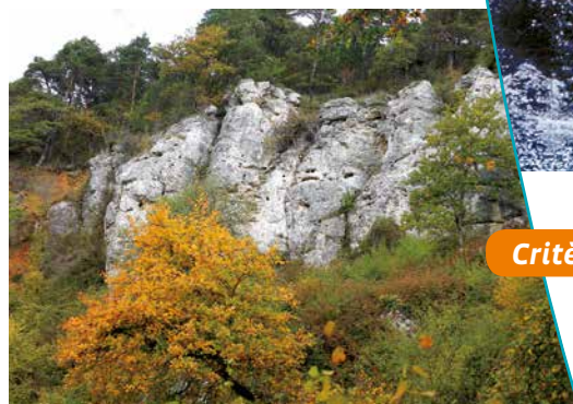
Au pied des falaises

récentes révèle le développement végétal conséquent qui atténue l'impact visuel important des falaises sur des vues lointaines. Toutefois, en haut des falaises, le « sentier de pays de la côte des Blancs » permet la découverte d'un très beau panorama sur le vignoble et le plateau de la Brie.