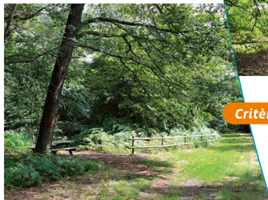
Vue d'ensemble avec les aménagements à proximité du fau

L'Office National des Forêts a assuré son dégagement et maintient depuis un entretien régulier sur ce site. Cet arbre présente toujours un bon état général et fait l'objet d'une gestion forestière adaptée.