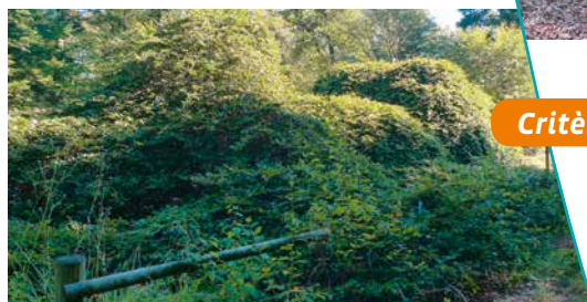
Cascade de faux

branches tordues) confirme que les Faux sont bien des mutants du hêtre commun. Cette mutation est vraisemblablement due à un agent infectieux présent en forêt de Verzy et expliquerait l'existence de la morphologie tortillard également sur des chênes et des châtaigniers, incapables de se reproduire par marcottage contrairement au hêtre. Environ 800 spécimens sont aujourd'hui recensés. Un circuit est aménagé pour découvrir l'origine des faux.