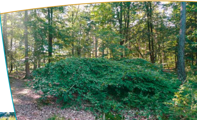
Fau avec reversion partant d'une branche