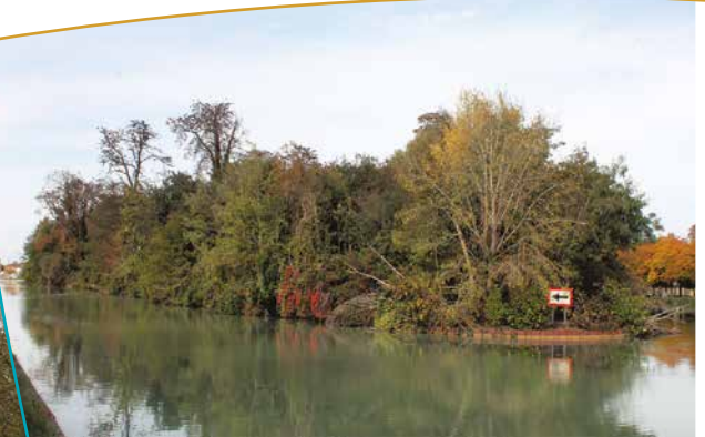
L'île depuis le chemin de l'écluse