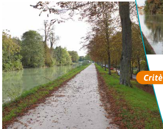
Le chemin de l'écluse en direction de la passerelle

Le conseil municipal de Châlons-en-Champagne était désireux de conserver ce site pittoresque qui constitue un des principaux attraits de la ville. Il a sollicité le classement parmi les sites et monuments naturels de cet ensemble auprès du Préfet en 1928.