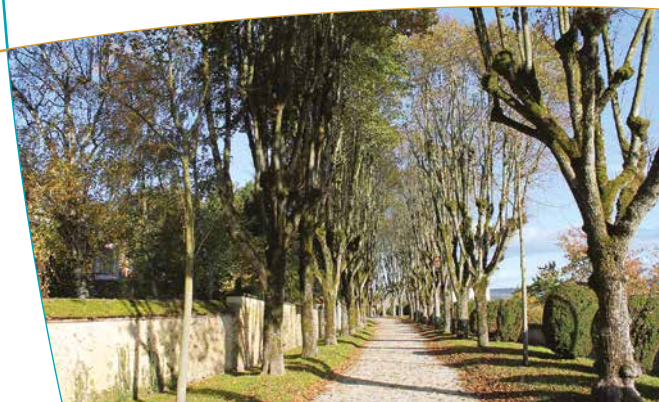
Mail des Religieuses

tout comme celui des Religieuses, il est parfaitement aménagé comme lieu de promenade privilégié pour les habitants de Sézanne, offrant un belvédère sur le vignoble de Champagne. Les Mails du Mont Blanc, de Provence et de Marseille sont ouverts à la circulation. Le Mail de Marseille est constitué d'un quadruple alignement de tilleuls, formant deux allées centrales bordant une chaussée et deux contre-allées. Le Mail de Marseille et celui des Acacias ont quant à eux conservé une relative quiétude.