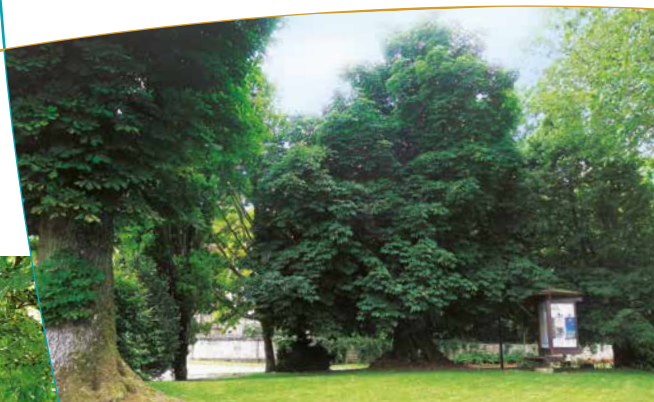
Le marronnier classé et son voisin