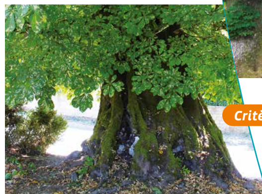
À l'ombre sous le houppier

Progressivement dégradé depuis les années 70 par des chutes de branches ou des impacts de foudre mais toujours imposant par sa circonférence, le marronnier continue de trôner au milieu de la place centrale du village d'Haussignemont.