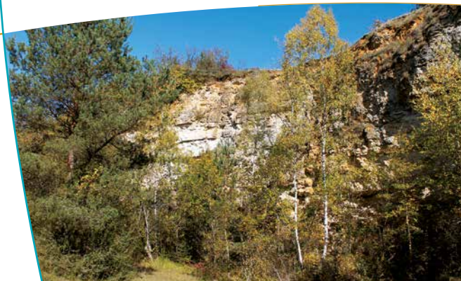
Front de taille d'anciennes carrières

et l'ère tertiaire : son intérêt scientifique débord largement le cadre régional. Le Mont Aimé est entouré de vignobles et présente de belles promenades ombragées. Un promontoire comporte une table d'orientation en lave d'Auvergne émaillée qui a été refaite au début des années 2000 (la première datait de 1909). Il permet d'admirer le panorama qui montre bien l'intérêt stratégique de cette butte. L'association des « Amis du Mont Aimé » œuvre pour la protection et la valorisation du site ; elle en assure l'entretien régulier ainsi que son animation culturelle.