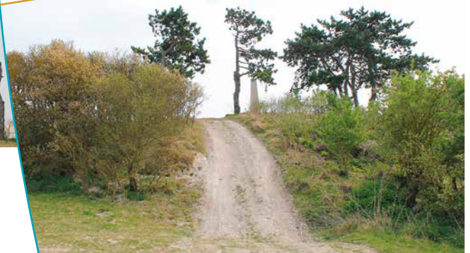
Chemin d'accès à la pyramide

qui témoignent d'un ancien village avec château, église et cimetière. De nombreuses archives mentionnent l'existence de ce village. Sans doute au XIV ème siècle, le village disparaît lors du siège de Reims par les anglais qui rasèrent des localités entières tout autour de Reims. En 1677, l'église du Mont Saint-Pierre, abandonnée et pillée, fût transférée au village de Tinquieux. Plus récemment, c'est sur ses flancs qu'a été repoussée l'invasion allemande sur Reims en 1918.