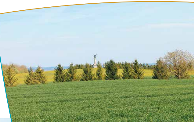
Statue du général Kellermann depuis le moulin