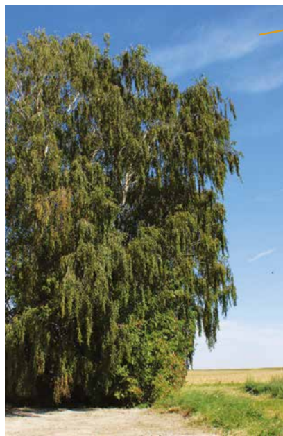
Bouleaux marquant la limite des communes

Cet orme, au moment du classement, mesurait 5,87 mètres de circonférence et la hauteur du fût était d'environ 2 mètres. La ramure, assez régulière, formait un bel ensemble de 18 à 20 mètres de haut avec un développement latéral de 30 mètres sur les diamètres. Les quatre branches mortes ne paraissaient pas influer sur la vitalité de l'arbre dont le feuillage était encore bien garni. Abattu en 1949 en raison de son état sanitaire et du risque de chute de grosses branches, le gros orme a été remplacé par un bouquet de bouleaux qui marquent encore les limites communales.