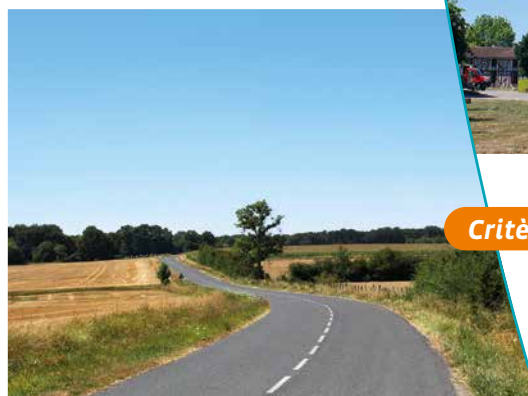
Vue sur les champs et la forêt qui ceignent le village

manquait pour la construction) se retrouve en effet aussi bien dans les maisons peu élevées du village que dans l'église Saint Nicolas d'Outines (datant du XVI ème siècle), qui est la plus vaste église à colombages de la Marne.