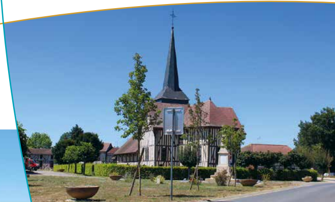
Vue d'ensemble de l'église