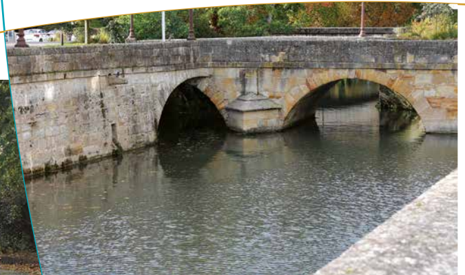
Le pont des Viviers