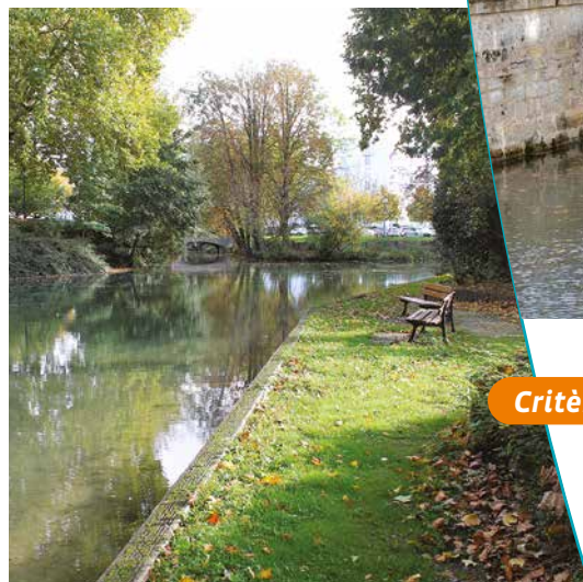
La confluence du Mau et du Nau et les arbres qui la bordent

Le Mau (affluent de la Marne) et le Nau (qui en est une dérivation) parcourent l'un et l'autre la ville de Châlons-en-Champagne pour se rejoindre devant le palais de justice de la ville. Le pont des Viviers a été construit en 1627 sur deux arches décalées en quart de sphère. Le pont des Mariniers, qui date de 1560, était autrefois intégré dans les remparts de la ville. Délimité par ces deux ponts, le confluent du Mau et du Nau génère autour de lui un site très agréable, grâce notamment aux berges aménagées de part et d'autre des canaux. L'ensemble constitue un lieu de promenade privilégié pour les Châlonnais.