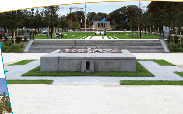
Monument en mémoire des martyrs de la résistance