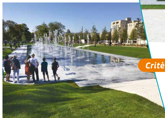
Aménagement en eau