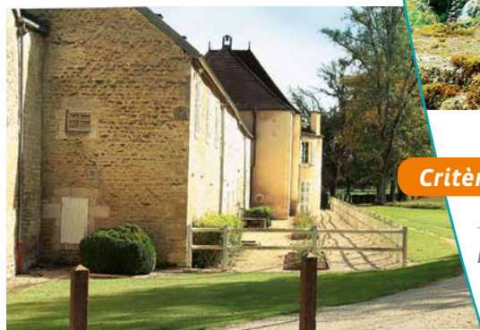
Côté de la ferme face à la cascade

tour date du XVII ème siècle. Cette propriété appartient à la même famille depuis neuf générations et n'a subi aucun morcellement des terres qui s'étendent sur 700 hectares tout autour de la ferme. Cette protection foncière confère au site un paysage d'une grande sérénité, constitué de prairies et de forêts.