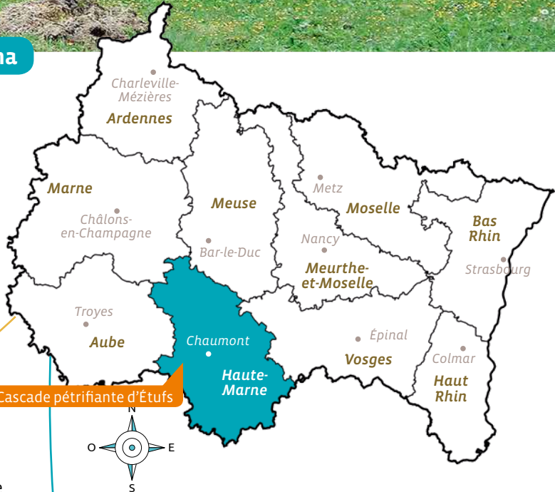
Cascade pétrifiante d'Étufs

Située dans la vallée de l'Aube et surplombant le château et la ferme d'Étufs, la cascade pétrifiante d'Étufs était considérée comme la plus importante curiosité naturelle de la Haute-Marne.