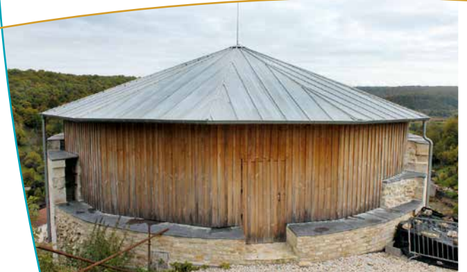
La tour au puits surplombant le village

est constituée de murs très épais. La façade exposée à l'est présente un rez-de-chaussée (ancienne salle de réception seigneuriale) comprenant une entrée arrondie dans sa partie supérieure et encadrée par deux colonnes qui supportent un fronton sculpté. Au-dessus, les trois fenêtres superposées que l'on voit correspondent à trois étages. Le toit a été refait. Un autre vestige à l'extrême Est du site domine l'église de Vignory ; cette tour dite « tour au puits » doit son nom à l'existence d'un puits sur lequel elle fut construite. Vu sa disposition, elle devait avoir un rôle important pour guetter d'éventuels assaillants.