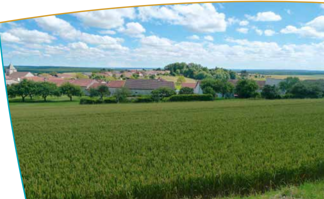
Village de Colombey

que de la Boisserie, demeure bourgeoise datant de 1850 et acquise par le général de Gaulle en 1934. Désirant posséder une maison de campagne pour y réunir sa famille, le Général a choisi Colombey car le village était à mi-chemin entre Paris et les garnisons de l'Est et du Nord de la France. Le centre de Colombey a été bien préservé : l'habitat traditionnel s'intègre dans des espaces de nature bien entretenus. Les perspectives et cônes de vue lointains depuis les lieux historiques et les principaux lieux de visite ouvrent toujours sur une campagne si bien décrite par le Général De Gaulle.