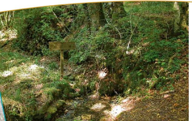
Sources de la Vingeanne