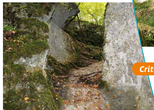
Gorges de la Combe Royer

forêts, des versants calcaires bien ensoleillés ainsi que des espèces montagnardes localisées dans les forêts de versants nord et dans les gorges. Une avifaune variée y trouve également des conditions favorables à sa nidification (passereaux, rapaces et pics).