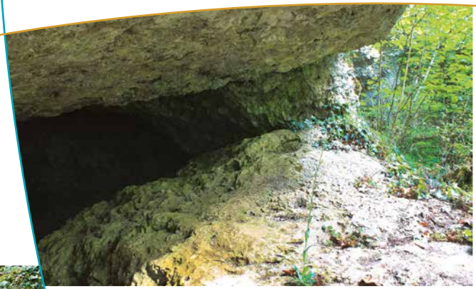
Entrée de la grotte