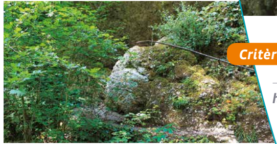
Aménagement de l'accès à la grotte