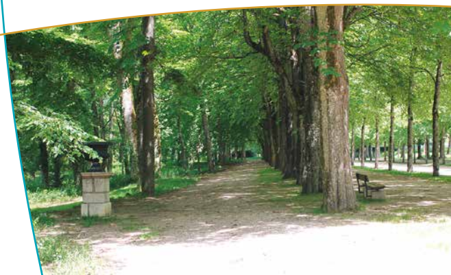
Aménagement au sein de la promenade