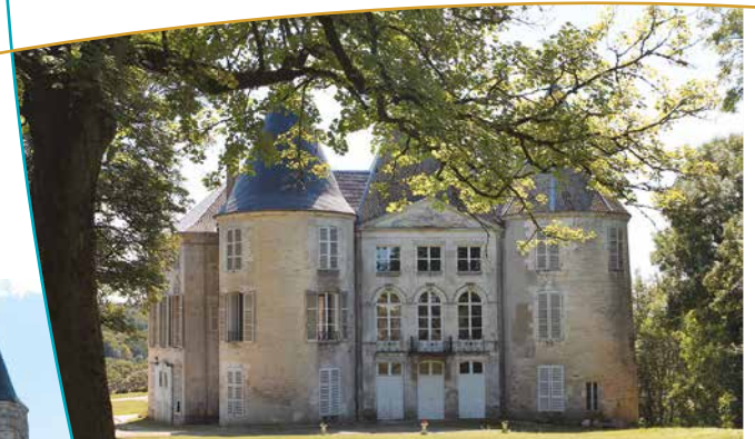
Château de Reynel