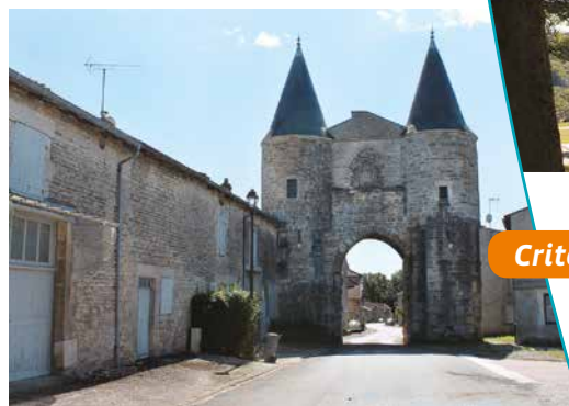
Porte du village

par une vaste construction plus moderne. Une étroite artère faisait le tour des murailles et a conservé, dans sa partie occidentale, le nom évocateur de Rue des sept tours. Le plan n'en a pas changé depuis cette époque.