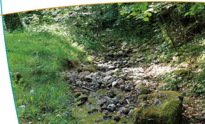
Écoulement de la Marne dans la continuité de l'ouvrage maçonné