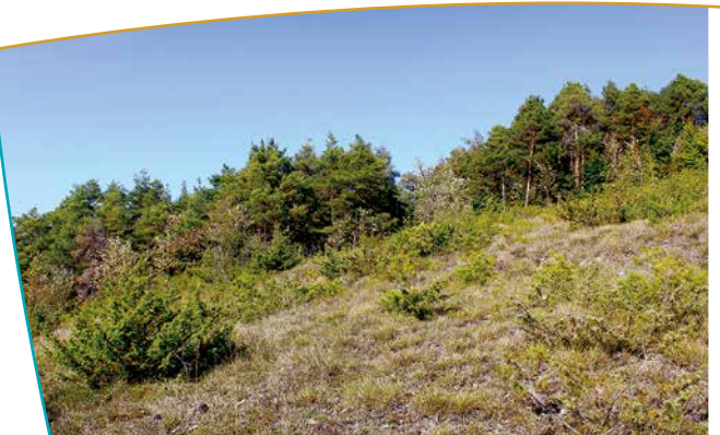
Pelouse et boisement de pins sylvestres

dominée par des graminées, surtout la séslerie bleue et le brome dressé. Plus d'une trentaine d'espèces rares s'y développent : la gentiane germanique, la gentiane ciliée, la phalangère rameuse, l'hélianthème des Apennins et diverses orchidées, ainsi que la violette rupestre, le thésion des Alpes, le silène glaréux et la laîche pied d'oiseau, quatre espèces protégées régionalement, ainsi que l'aster amelle protégée au niveau national. Certains insectes très rares en Haute-Marne y sont également recensés, en particulier des papillons (l'azuré du serpolet) et des criquets (le psophe stridulant).