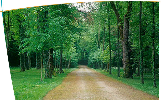
Parc et allée

fut donné aux moines un terrain mieux situé, devenu l'actuel Val des Escholiers. L'histoire de ce prieuré connut les vicissitudes de l'ancien comté de Champagne, tout en poursuivant son activité pédagogique. De nombreux privilèges vinrent renforcer la puissance de la congrégation mais il fallut attendre le début du XVI ème siècle pour que ce prieuré soit érigé en abbaye, alors que son rôle spirituel décroissait considérablement. Sous Louis XIV, une partie de l'abbaye était déjà en ruines et, à la veille de la Révolution, il ne restait plus que 3 à 4 moines. La communauté fut supprimée en 1790 et les bâtiments passèrent dans le domaine privé.