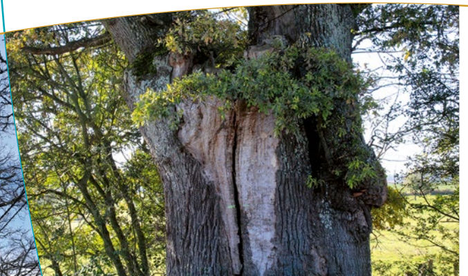
Le tronc du chêne