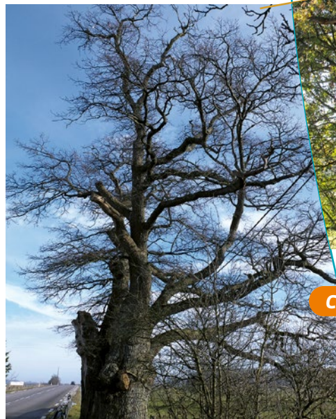
Le chêne de la Vierge en hiver

Ce chêne est très âgé. En 1935, il mesurait déjà 5 m de circonférence et 10 m de haut. Le fût mesure environ 3,50 m. Il est creux sur presque toute sa longueur et ne présente plus dans cette partie qu'une portion de couronne de bois de 15 à 30 cm d'épaisseur sur les 2/3 environ de sa circonférence. Les soldats de l'Empire y auraient, paraît-il, installé un foyer lors d'un de leur passage. Situé contre la glissière de sécurité de la RN19, ses conditions de vie ne sont pas optimales. Il semble, toutefois, que cet arbre puisse vivre encore longtemps. La cime est assez développée et encore vigoureuse.