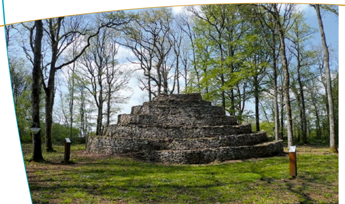
Le grand escargot