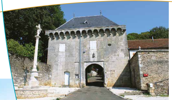
Porte menant à l'église