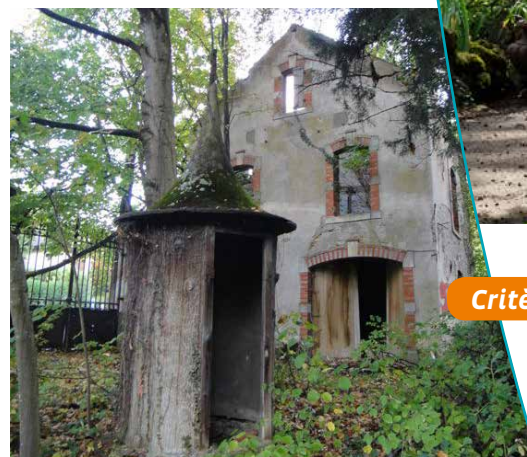
Grille, pavillon et gloriette à l'entrée du parc de l'Abiétinée

A proximité immédiate du parc, la Cure d'Air Trianon était une guinguette de style Art Nouveau, comprenant une brasserie et une piste de danse. La structure métallique et quelques vitraux,