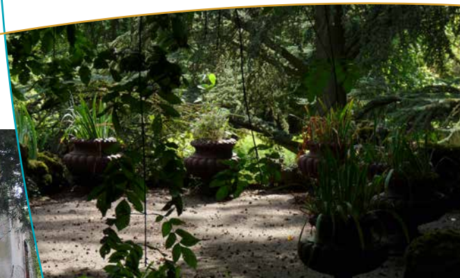
Vases sur la terrasse de la cure d'air Trianon