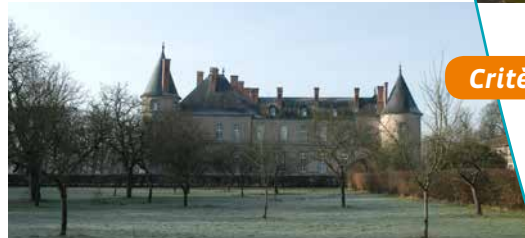
Vue depuis le verger