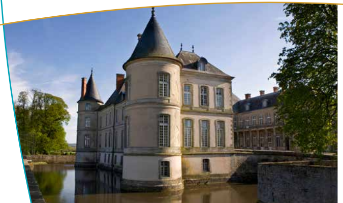
Les douves du château

Autour, le paysage qui enferme le cours sinueux du Madon forme une unité paysagère remarquable. Depuis l'arrière du château, la vision embrasse une vaste perspective, longue coulée de verdure terminée par les sommets forestiers des Bois de la Banvoie et d'Arpontois.